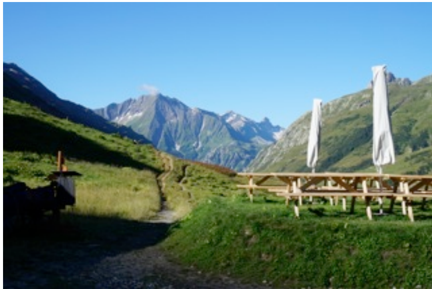
A proximité du refuge des Mottets