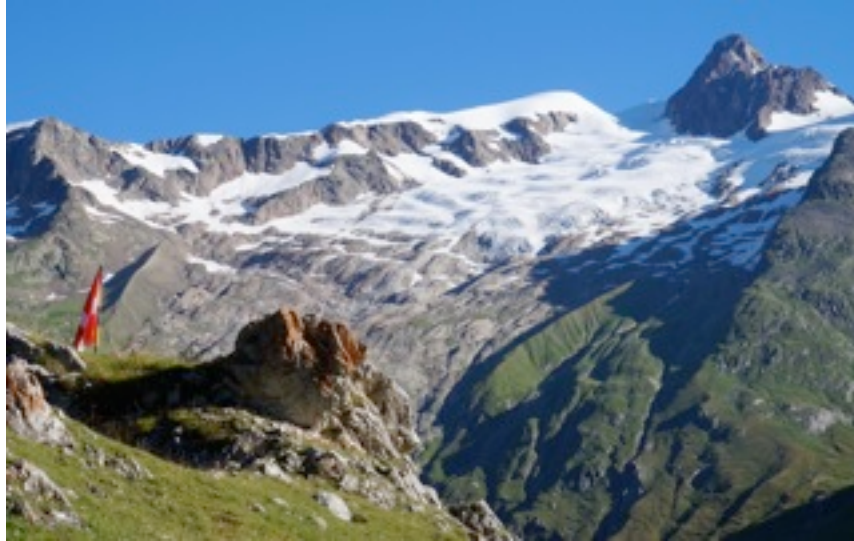
L'aiguille des Glaciers